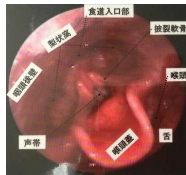
【内視鏡下で観察した咽頭】

食事や水分、唾液などでむせやすい/食事を噛んだまま飲み込めない/ 誤嚥性肺炎を繰り返している/食事量が低下している/体重が減少している/ 現在胃瘻や経鼻栄養をしているが、口から食べる訓練を開始したい など