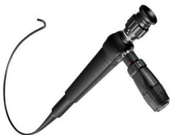
【当院の嚥下観察用内視鏡】 (PENTAX FNL-10RBS)

咽頭・喉頭の粘膜を直視できるので、食形態の評価や唾液・分泌物の貯留の有無が観察できます。 嚥下内視鏡検査では、普段食べている食べ物・飲み物で評価ができるといった利点があります。 また、持ち運びやすく、在宅や施設への往診にも対応可能です。