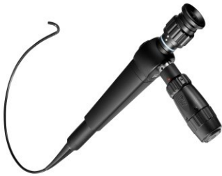
【当院の嚥下観察用内視鏡】 (PENTAX FNL-10RBS)

咽頭・喉頭の粘膜を直視できるので、食形態の評価や唾液・分泌物の貯留の有無が観察できます。嚥下内視鏡検査では、普段食べている食べ物・飲み物で評価ができるといった利点があります。また、持ち運びやすく、在宅や施設への往診にも対応可能です。