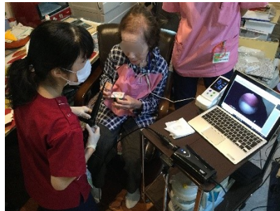
【在宅でのVE検査の様子】